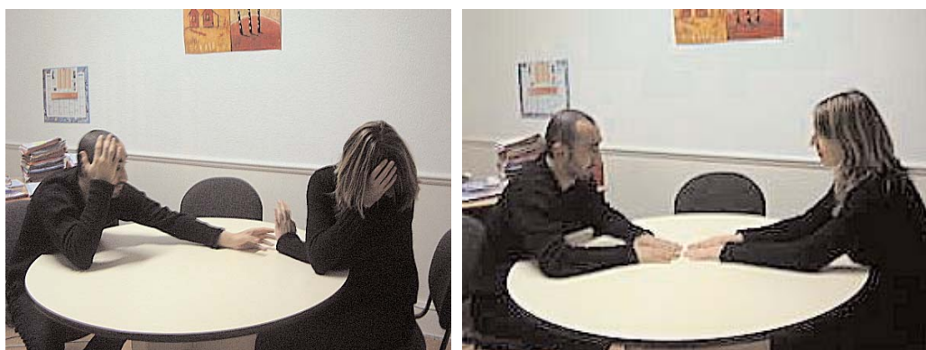
Permettre de renouer le dialogue

Il n'y a pas de vie sans conflit. Mais l'homme peut trouver une autre voie... Comme la médiation pénale.