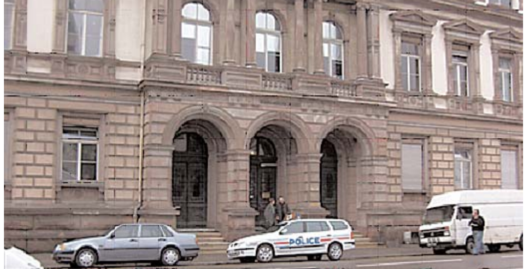
La Justice: monde impressionnant et méconnu.