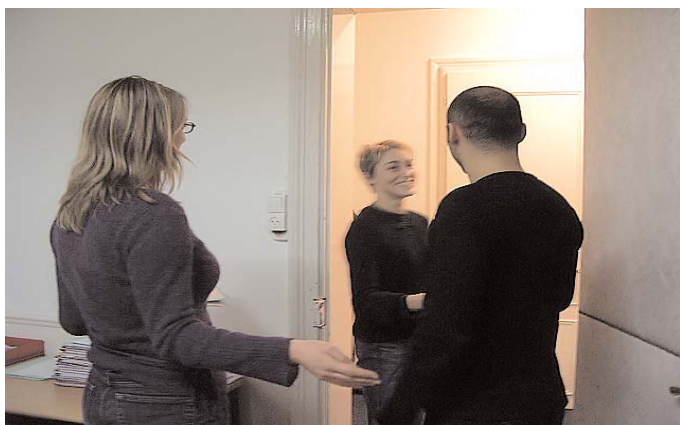
Permettre de désamorcer les litiges